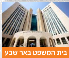
בית המשפט באר שבע