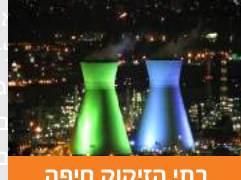
בתי הזיקוק חיפה