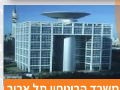
משרד הביטחון תל אביב