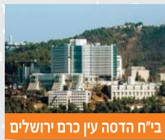
בי"ח הדסה עין כרם ירושלים